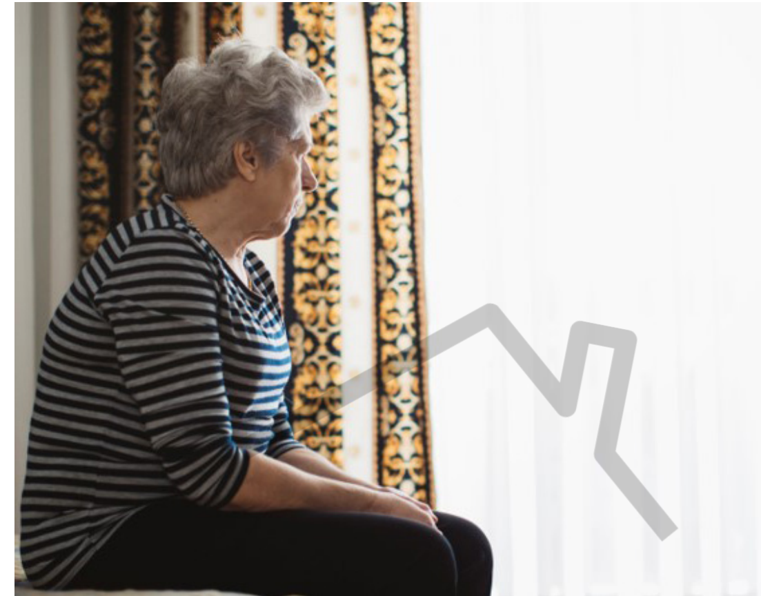
GUNE BAT KONPAINIAN EGOTEKO - UN ESPACIO EN COMPAÑÍA